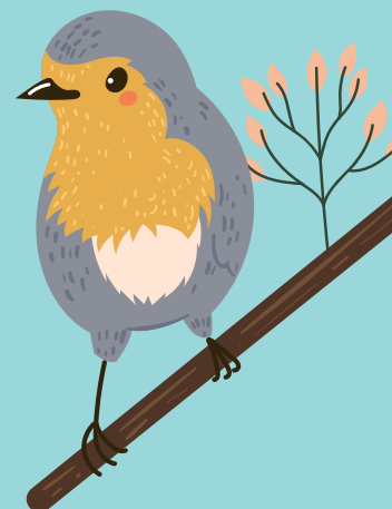
foto reiger en roodborstje, zoekkaart vogels, veertjes om weg te blazen.